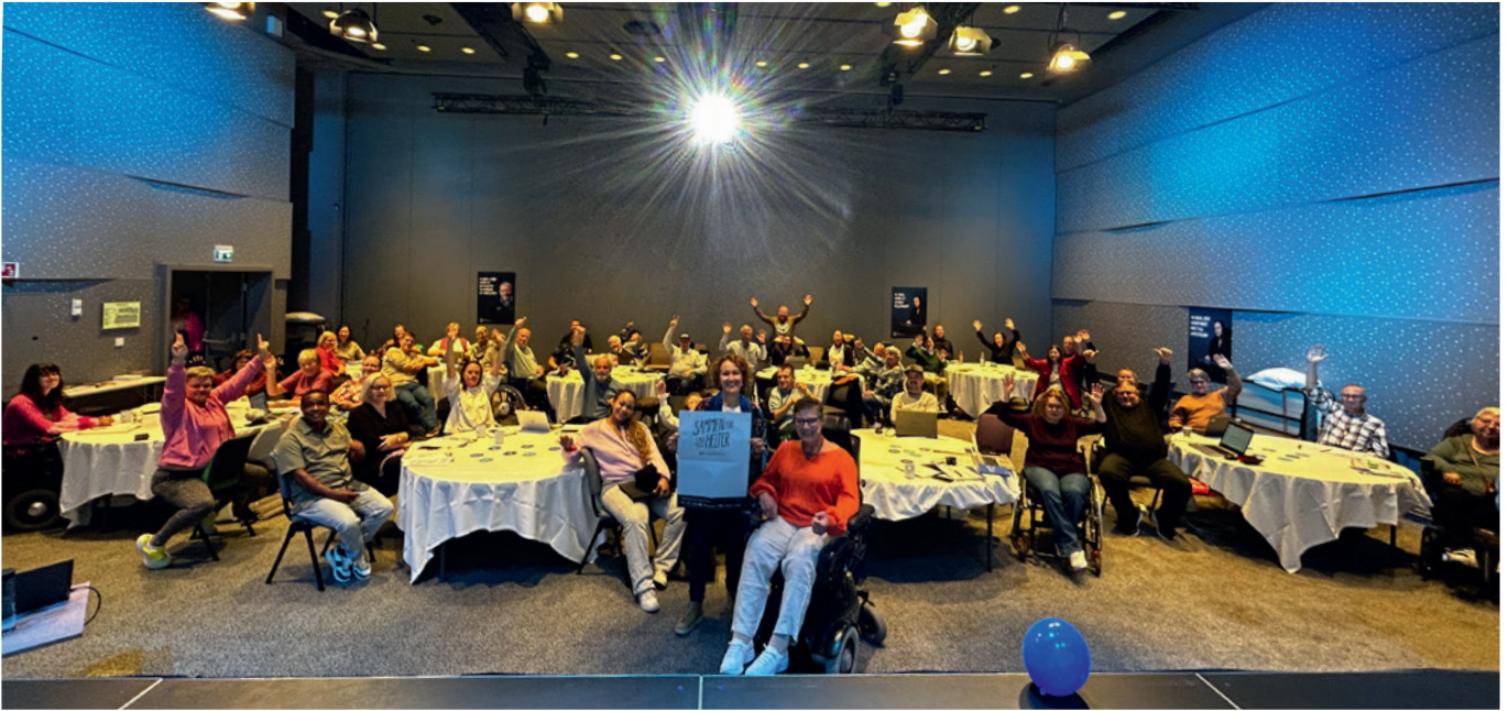
En engasjert lederkonferanse var samlet for lederkonferanse på Gardermoen.