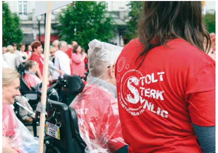
STOLTHETSPARADEN: I år gikk ferden fra appeller utenfor Stortinget, til storstilt show utenfor Østbanehallen ved Oslo S. Med trommekorps og en bølge av røde t-skjorter gjorde paraden seg bemerket nedover Karl Johans gate.