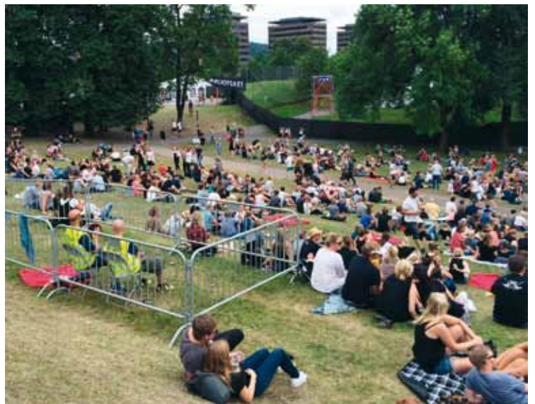
AKTIVE UNGE: NHFU Oslo gjorde en grundig befaring på årets Øya-festival, og sørget blant annet for bedre sikkerhet ved HC-området foran hovedscenen.