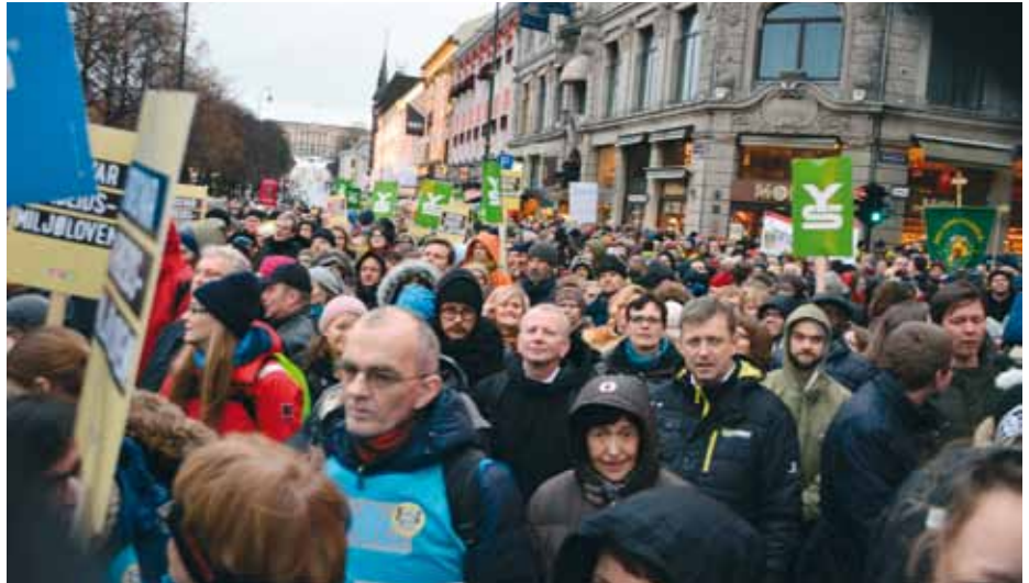
TRANGT: Mange deltok i streiken 28. januar.

Reaksjonene lot ikke vente på seg. Få dager etter innlegget ble hun intervjuet over førstesiden og to siders repor-