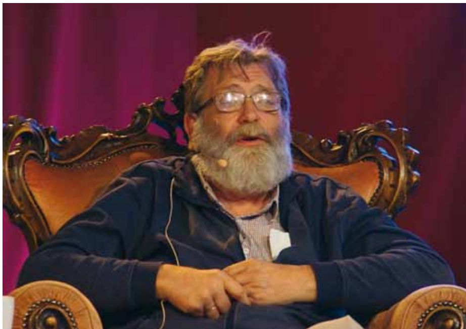
STORT OPPMØTE: Mange ville ha med seg Frank Aarebrot.

arbeidet med å se på hva slags arrangementer og gjester som kunne være aktuelle. Navn som Kristin Grue, Frank Aarebrot og Per Fugelli ble notert, og forespørsler sendt ut.