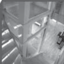
TKS A1 plattformheis med glass

Ta kontakt med oss for nærmere informasjon, og la oss være med og løse dine utfordringer.