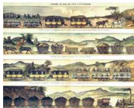
Standard for en hver tid.

Nå er det ikke særlig prioritert å heve dagens 70-stasjoner til 76 cm, disse