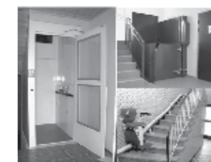
TKS AI plattform med glass

Ta kontakt med oss for nærmere informasjon, og la oss være med og løse dine utfordringer.