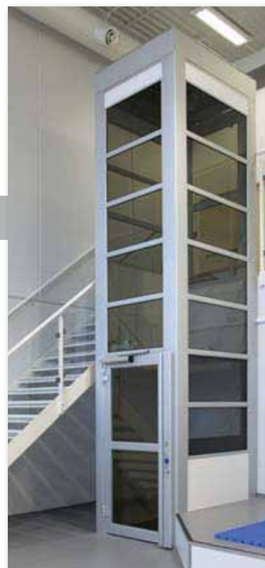
Heisen er typegodkjent

Besøk vår hjemmeside www.tksheis.no eller ta kontakt med oss TKS Heis AS tel: 4000 1059 E-post: post@tksheis.no