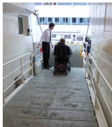
På tur i land i Svolvær.

Utfluktene til Hurtigruten er ikke tilrettelagt for gjester med elektrisk rullestol. Men på noen utflukter er det mulig å bruke manuell rullestol. Ett par unntak er det. I Tromsø med Ishavskatedralen og Trondheim med Niarosdomen er det mulig å bestille maxitaxi for å være med på utflukt også med el.rullestol. I Storkmarnes kan en gå i land og besøke Hurtigrutemuseet som ligger like ved kaien. I Svolvær er det kort vei til besøk i Magic Ice. Magic Ice er Norges første is-bar med utstilling og galleri, alt i krystallklar is. Her får man oppleve iskunst og kystkultur. Skulpturer og installasjoner av is, dramatisk lyssatt med lyd, musikk og bilder til. Livet i Lofoten danner rammen rundt opplevelsen.