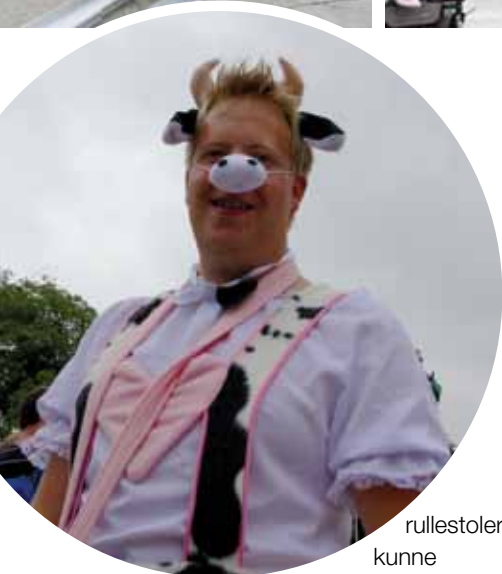
rullestoler, kunne dette bare gå

en vei. Spesielt siden det ble satt både internasjonale verdensrekorder og interplanetarisk verdensrekord, til publikums store fornøyelse.