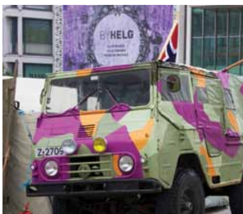
Et utvalgt knippe av bilder fra Funkisdagen i Stavanger.