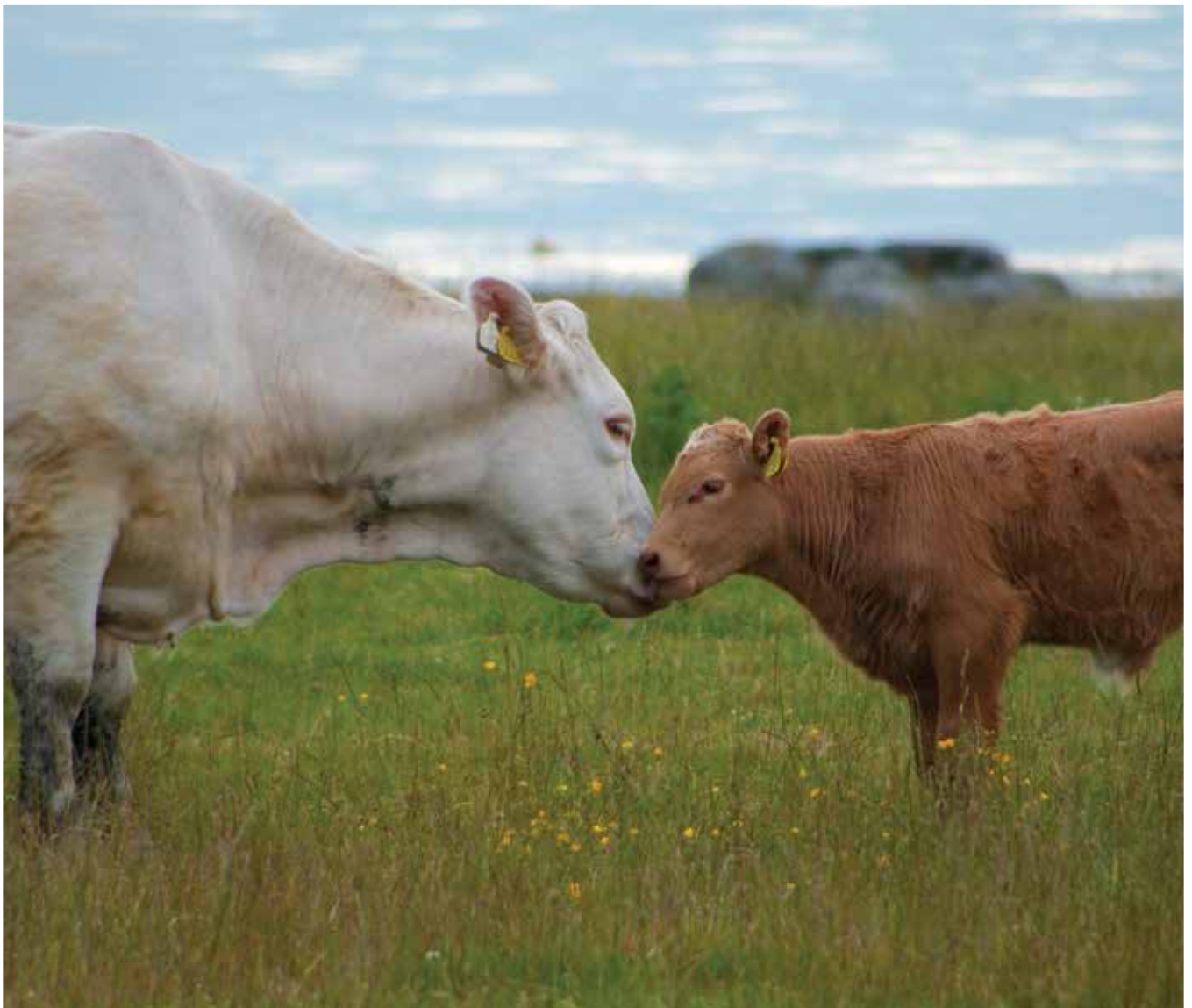
Idyll på Tungenes i Randaberg kommune. Den skal tidlig krøkes, som stor stut skal bli!

Redaksjonen utfordrer leserne av Sørvesten til å sende inn bilder. Motiv er fritt. Vi har fått tilbakemelding om at det er flere av bladets lesere som driver med dette. Nå er ballen kastet med håp om at du tar den.