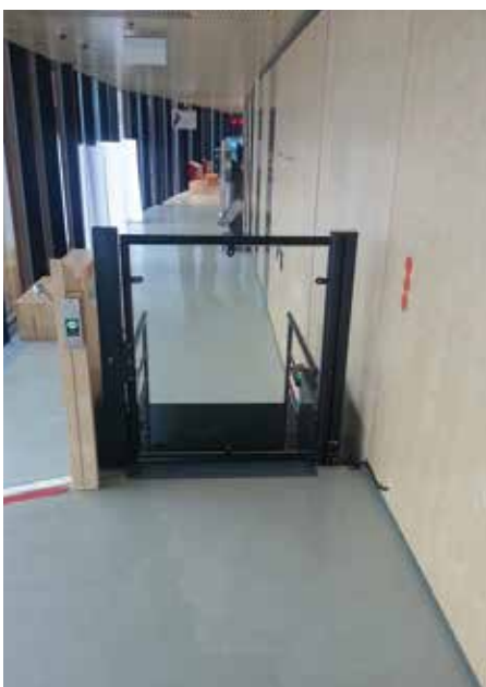
Mathallen er blitt universelt utformet.

Kommer en fra Vestre Strømkai må tunellen benyttes, kommer en fra Bergen Storsenter er det ett lite stykke utendørs før en er inne i terminalen. Fire innganger, 3 med dørautomatikk, en med svingdør. Inne er terminalen stor og åpen, med benker, Narvesen og toaletter og en billettautomat i akseptabel høyde for en som bruker rullestol. Det er flott. Det samme er det for infoskjermer. Kommer helt inntil og under, blir nesten som å sitte med en PC-berøringsskjerm på fanget. Har ikke sett noe bedre infoskjermer tilpasset rullestolbrukere enn disse. Norges Handikapforbund Bergen sammen med regionskontoret utarbeidet en rapport om Bybanen og det er tydelig at det har satt sine spor hos Skyss og vært til lærdom, og nytte ved utforming og innredning av Bergen Busstasjon.