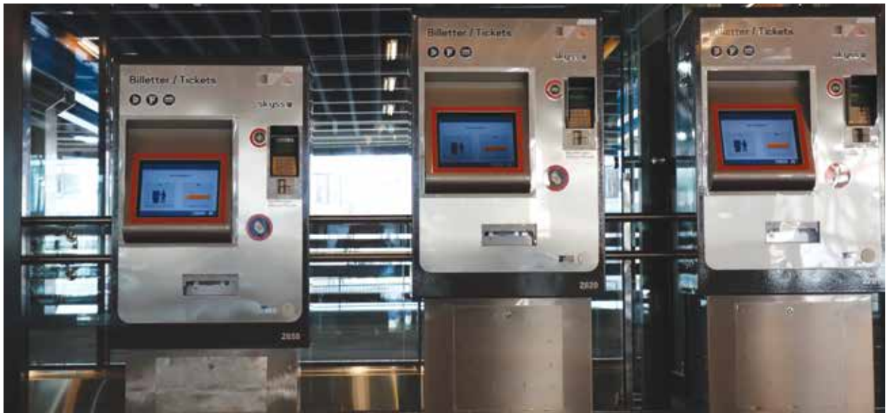
En av billettautomatene er nedsenket.