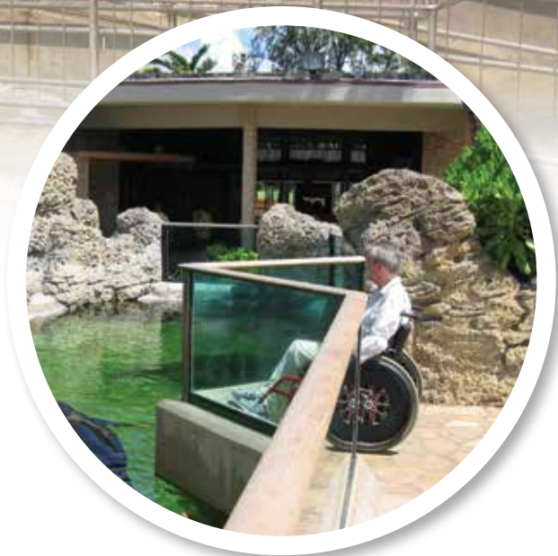
Utsiktsplattform i kombinasjon med glass.

Sommeren er i anmarsj og trangen til utendørs opplevelser gjør seg mer og mer gjeldende. For å finne eksempler på godt tilrettelagte løsninger til nummeret du nå holder i hånden, har Sørvestens utskremte medarbeider virkelig reist langt denne gangen. Undertegnede pakket kofferten og dro like godt til Hawaii!