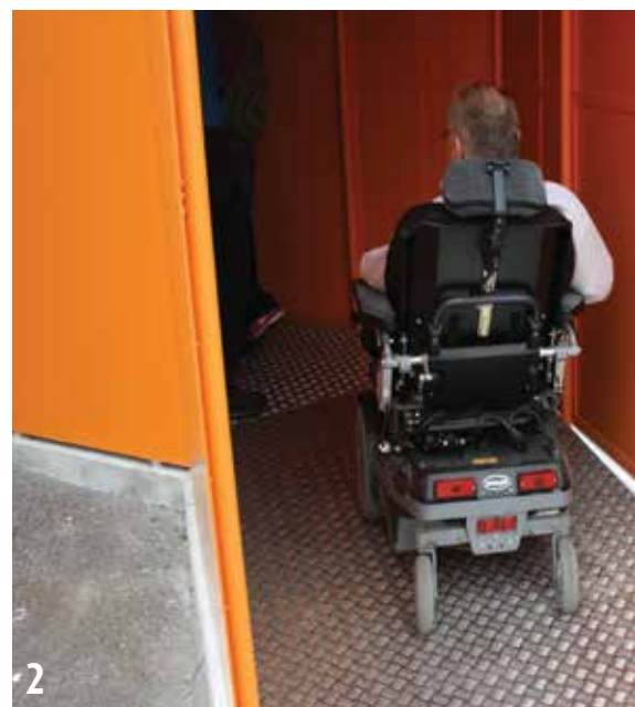
1 OG 2 HERDLA MUSEUM VED GUL 16: Kreativ løsning på rampe ved inngangen til hangaren hvor det tyske jagerflyet Focke Wulf 190 er utstilt. Jagerflyet styrtet i sjøen vest av Misje den 15.12.43. Det ble funnet av forsvarret i mai 2005 og heva året etter. Utstillingen åpnet i mai 2010 under overskriften "Frå kampfly til kulturminne". Med utgangspunkt i flyraket tar den publikum med på en reise som strekker seg over mer enn 60 år og som foregår både på bakken, i luften og under vann.