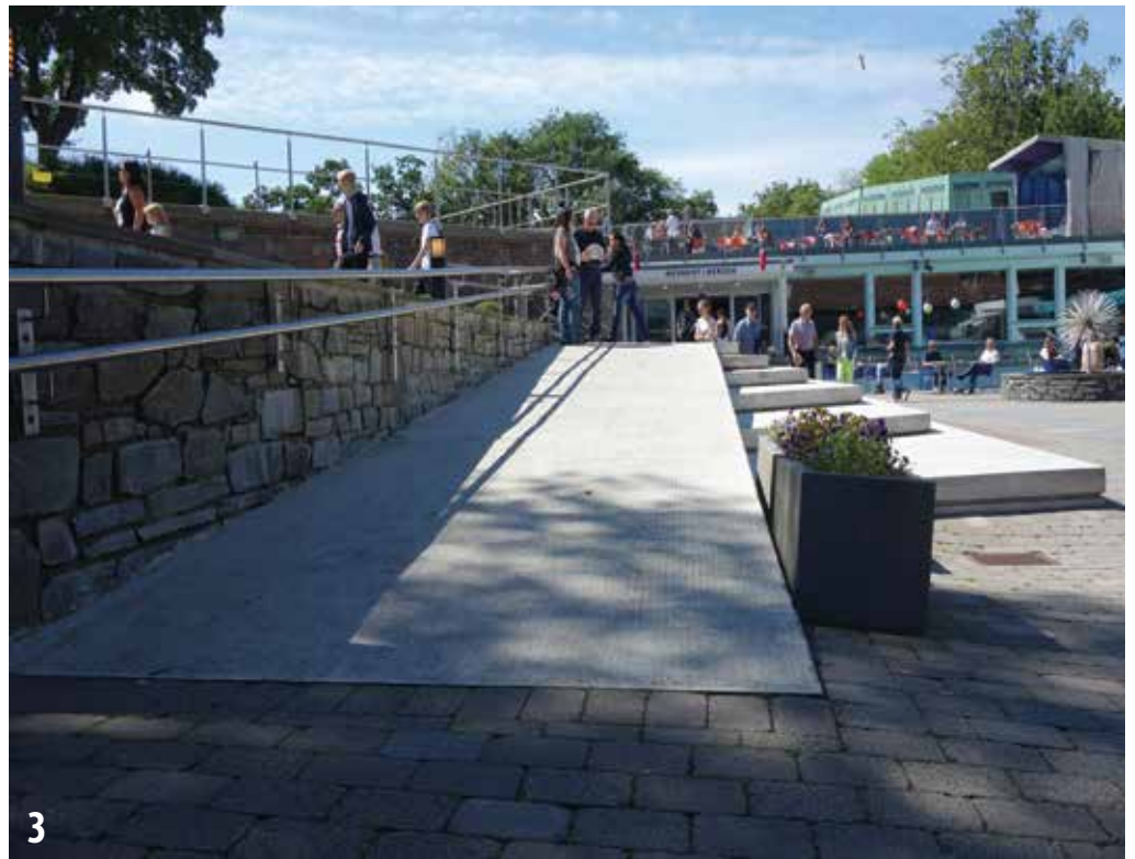
3 OG 4: AKVARIET I BERGEN Uteområdet på Akvariet er oppgradert de siste to årene. I juni 2013 var det åpning med nytt basseng for selene og pingvinene. Nye ramper og kjøreveier med håndlister og hvileplan.