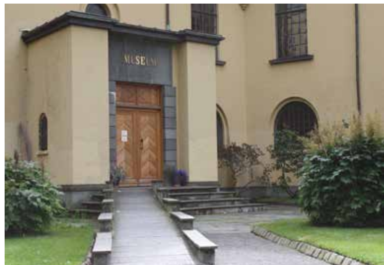
KULTURHISTORISK MUSEUM. Slak fin rampe som estetisk og i materialvalg står fint inngangspartiet.