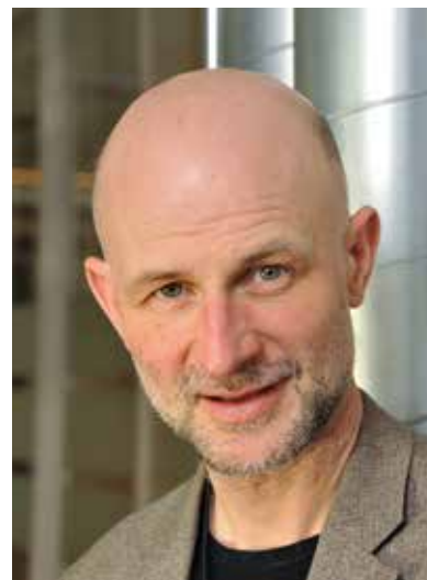
Erling Dokk Holm

Noen av landets største utbyggere påstår at romslige bad tilpasset rullestolbrukere forklarer hvorfor boliger er blitt dyrt. Det er feil forstått og kjøpt tenkt.