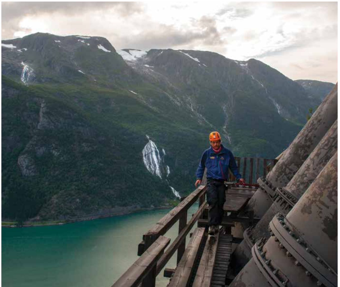
Ved rørenes begynnelse.

Redaksjonen utfordrer leserne av Sørvesten til å sende inn bilder. Motiv er fritt. Vi har fått tilbakemelding om at det er flere av bladets lesere som driver med dette. Nå er ballen kastet med håp om at du tar den.