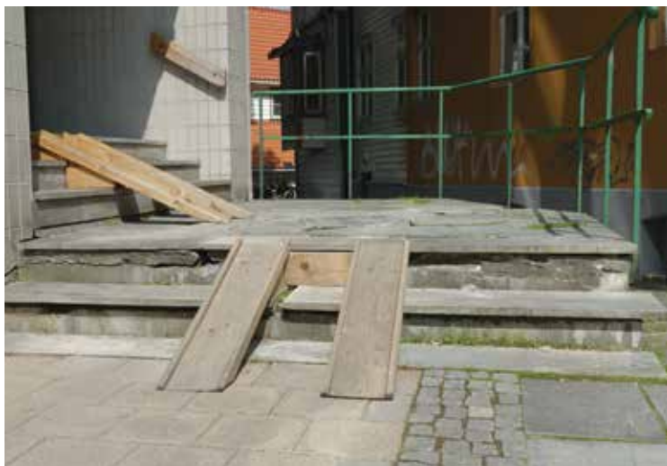
ETT STED I DREGGEN Trolig en vaktmester som har fått i oppdrag å lage rampe i trappen. Ikke 2014 standard.

På mine turer rundt i byen og omegn har jeg fanget opp noen ramper gjennom kameranlinsen. Fra nyeste utgave med håndlister og hvileplan til eldre og enklere ramper som gjør sin misjon til den mer amatørmessig og hjemmelaget versjon.