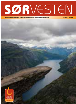
Forsidebildet: Trolltunga i Hordaland