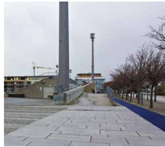
Stavanger stadion: her er det bare rampe - ingen trapp