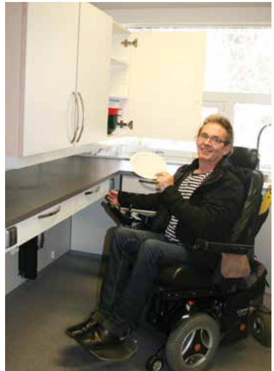
Undervisningskjøkkenet med hev/senk arbeidsplass!!!