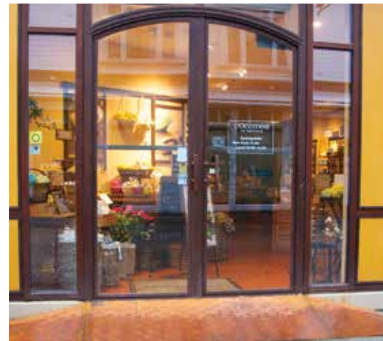
Sånn kan det gjøres