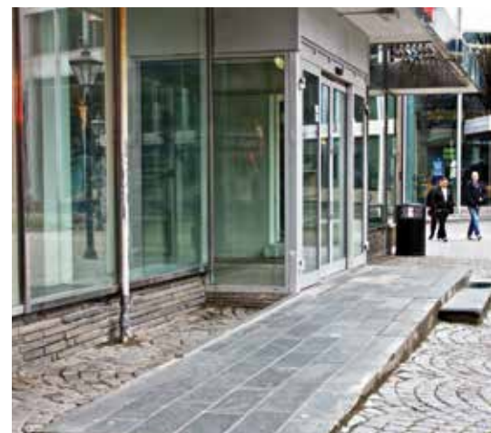
H&M har god adkomst