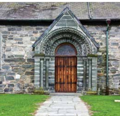
Domkirken - her er sideinngangen tilgjengelig med hjelp.