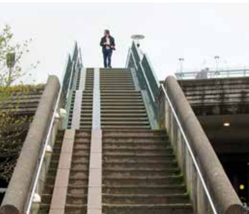
Jernbanestasjonen i Stavanger: Velkommen til en luftig opplevelse :) Parkeringsanlegget er opp her...