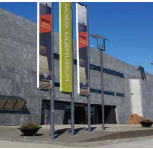
Oljemuseet har ingen trapp...