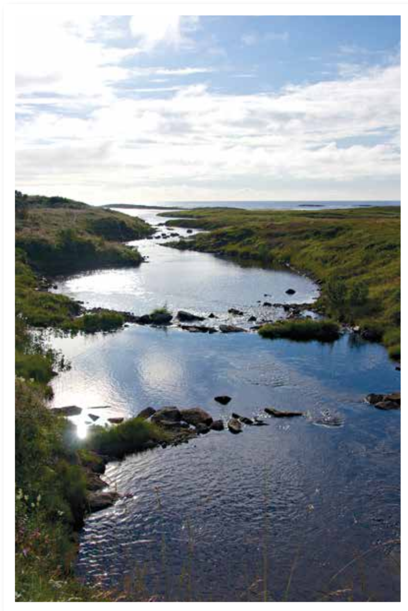
Sted: Stavaelva, Andøya i Versterålen

Redaksjonen utfordrer leserne av Sørvesten til å sende inn bilder. Motiv er fritt. Vi har fått tilbakemelding om at det er flere av bladets lesere som driver med dette. Nå er ballen kastet med håp om at du tar den.