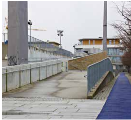
Stavanger stadion: nærbilde av rampen