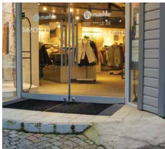
Oops... Skulle de også inn???