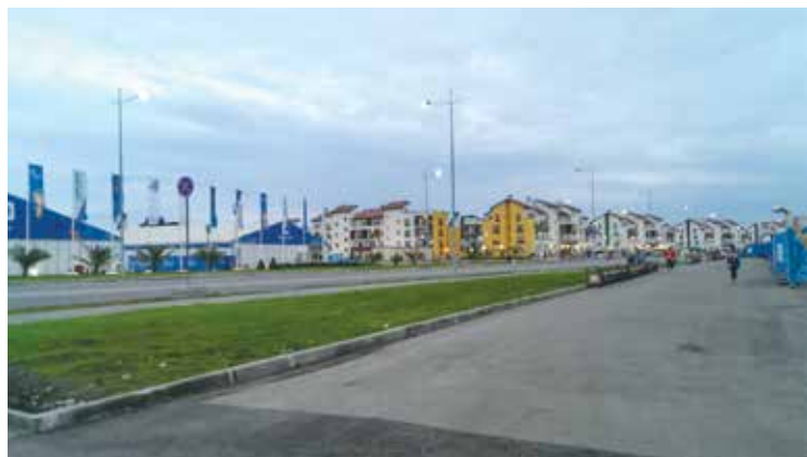
Blokkene hvor deltakerne bodde.