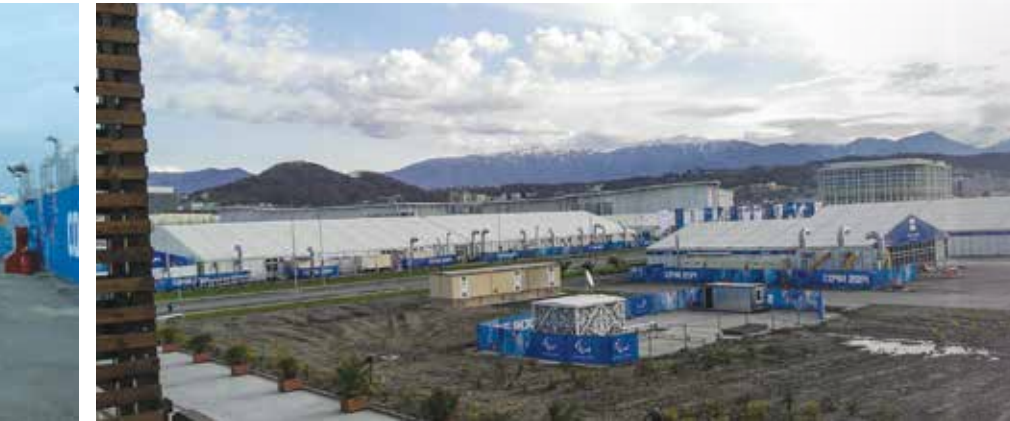
Utsikt fra balkong på rommet mot matsal, treningssal og salen for sosialt samvær.

Den var stor, og besto av flere store blokker og bygninger. I blokkene bodde deltakerne, det var medisinske senter, hjelpemiddelreparatør, treningsstudio, oppholds/avslapningssenter, butikker og matsal. Alt var nybygget og universelt utformet.