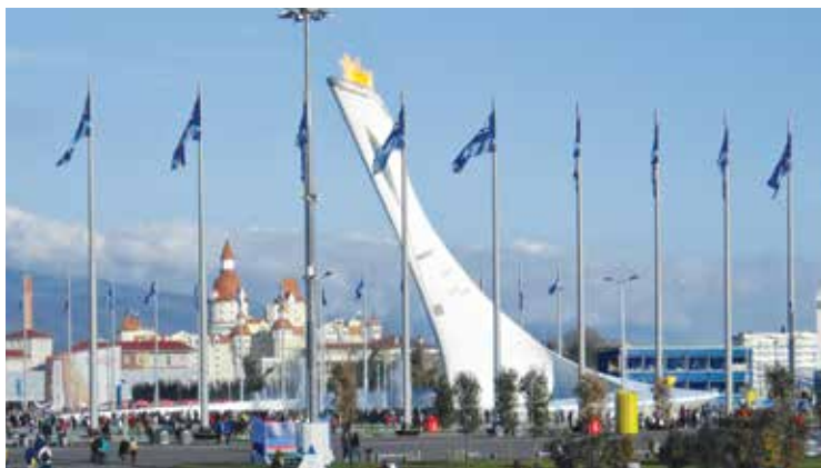
Den paralympiske flamme.