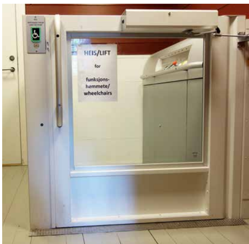
Heisen opp til 2. etasje.

en svært viktig aktør i formidlingen av kulturminnet i sin helhet.