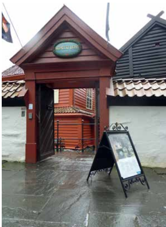
Inngangen ved Mariakirken.