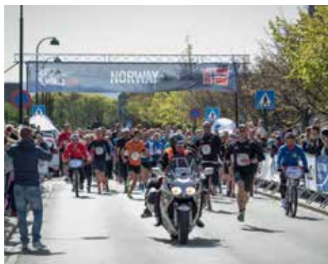
Fjorårets startfelt i Stavanger.

Nytt av året er at rullestolbrukere og løpende stiller sammen på startstreken! Kjente idrettsutøvere gjør også ære på arrangementet, både ved å konkurrere og