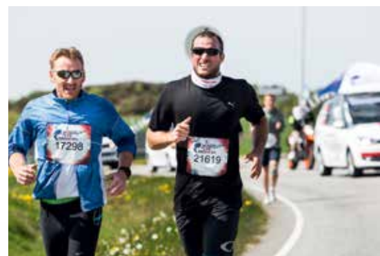
Aksel Lund Svindal (t. h.) stiller også i år!