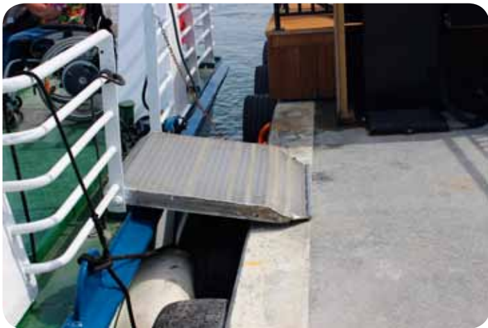
Atkomsten fra båt til kai er plan

Både båten fra 1974, kaia på Ravnkloa, atkomst kafe og brostein på Munkholmen byr på utfordringer. Men selv om mye gjenstår, vil vi gi skryt til Trondheim kommune og Statsbygg for den gode kai-løsningen på Munkholmen.