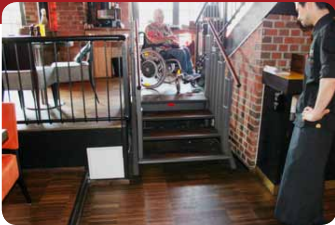
Heisen ser ut som en vanlig trapp

Flere av restaurantene på Solsiden i Trondheim var de første som fikk pålegg av LDO til å utbedre lokalene sine. Nå har «Sebastian» installert en fiffig og lite plasskrevende løsning. Selv om vi i utgangspunktet ikke anbefaler løsninger som har påholden manøverknaapp, så er denne heisen en god løsning på dette stedet. Heisen gir atkomst til nivå med bardisk og handikoptolett.