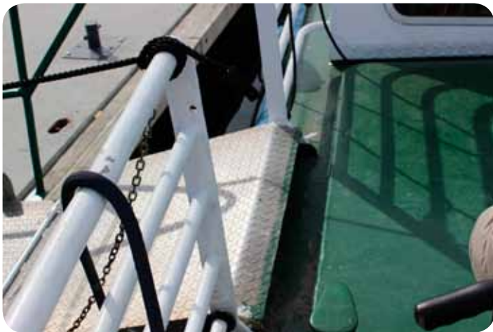
Det er stor avstand fra rampe til dekk