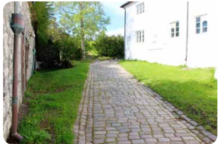
Dagens vanskelige brostein skal erstattes med flatere heller