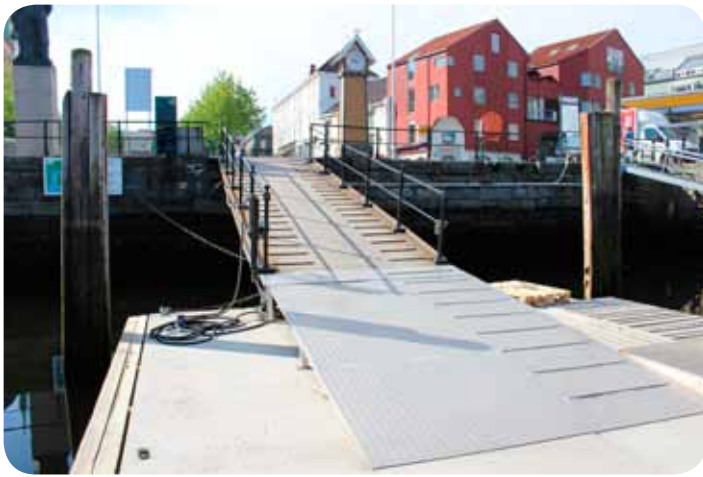
Kaia i Trondheim er fortsatt bratt og vanskelig ved fjære