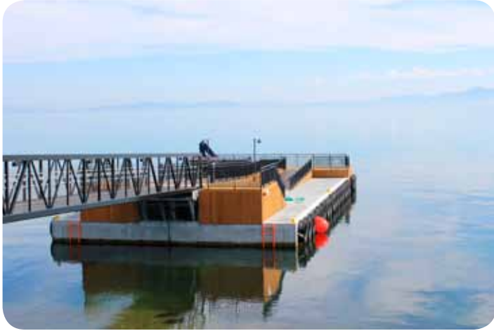
Den nye kaia er både pen og praktisk

Den historiske øya utenfor Trondheim har lenge vært en uinntakelig festning for bevegelseshemmede. Nå er ny flytekai på plass og atkomsten på Munkholmen er betraktelig bedre. Men bruker du elektrisk rullestol, vil Munkholmen fortsatt være utilgjengelig. Med manuell rullestol trenger du assistanse flere steder.