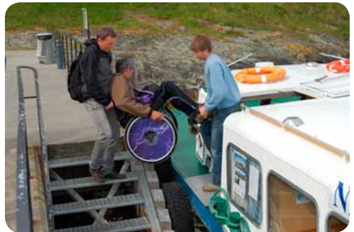
Tidligere var atkomsten et sjansespill