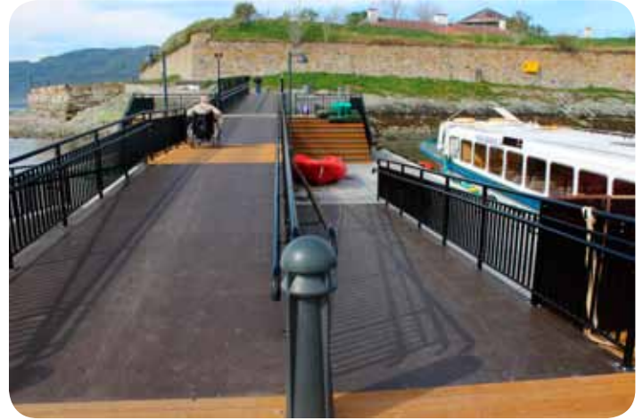
Brede ramper og akseptabel stigning også på fjære

18. mai fikk båten legge til den nye kaia som kostet 14 millioner kroner. RegionNytt har sett på anlegget og vi er imponert over funksjonaliteten og estetikken. Med den nye kaia på plass er det vanskeligste hinderet utbedret. Men likevel er det andre hindre som gjør turen mer vanskelig enn vi skulle ønske.