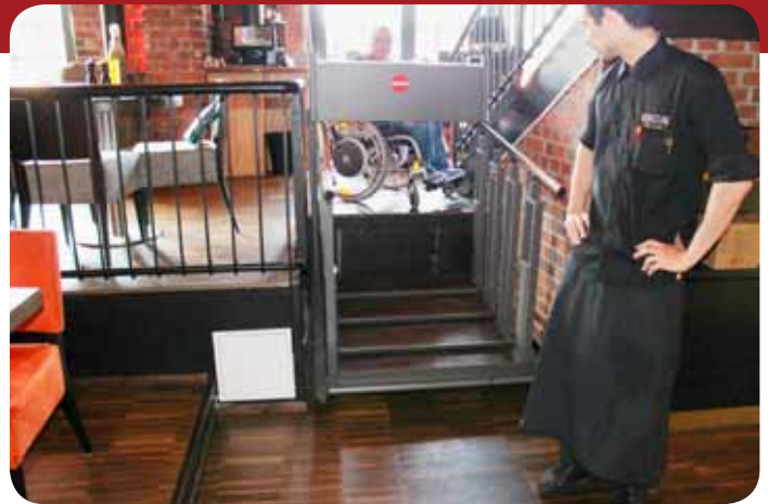
Trappetrinnene legger seg sammen