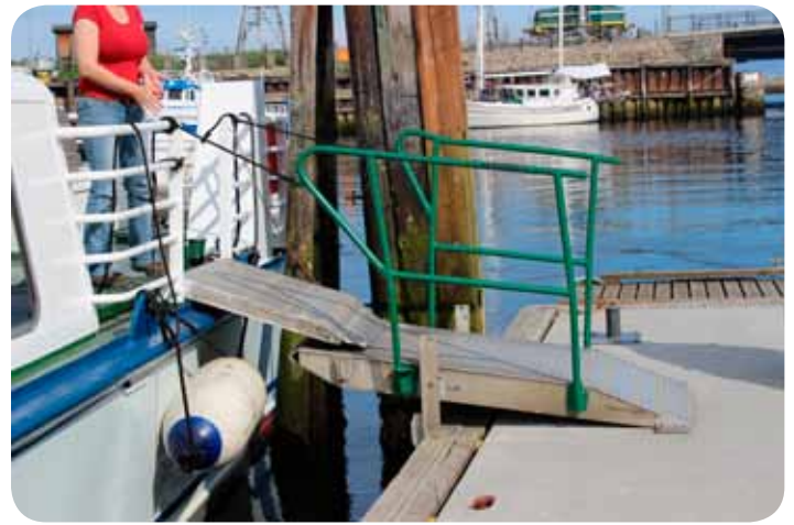
Atkomsten fra kai til båt krever bistand til noe løfting.