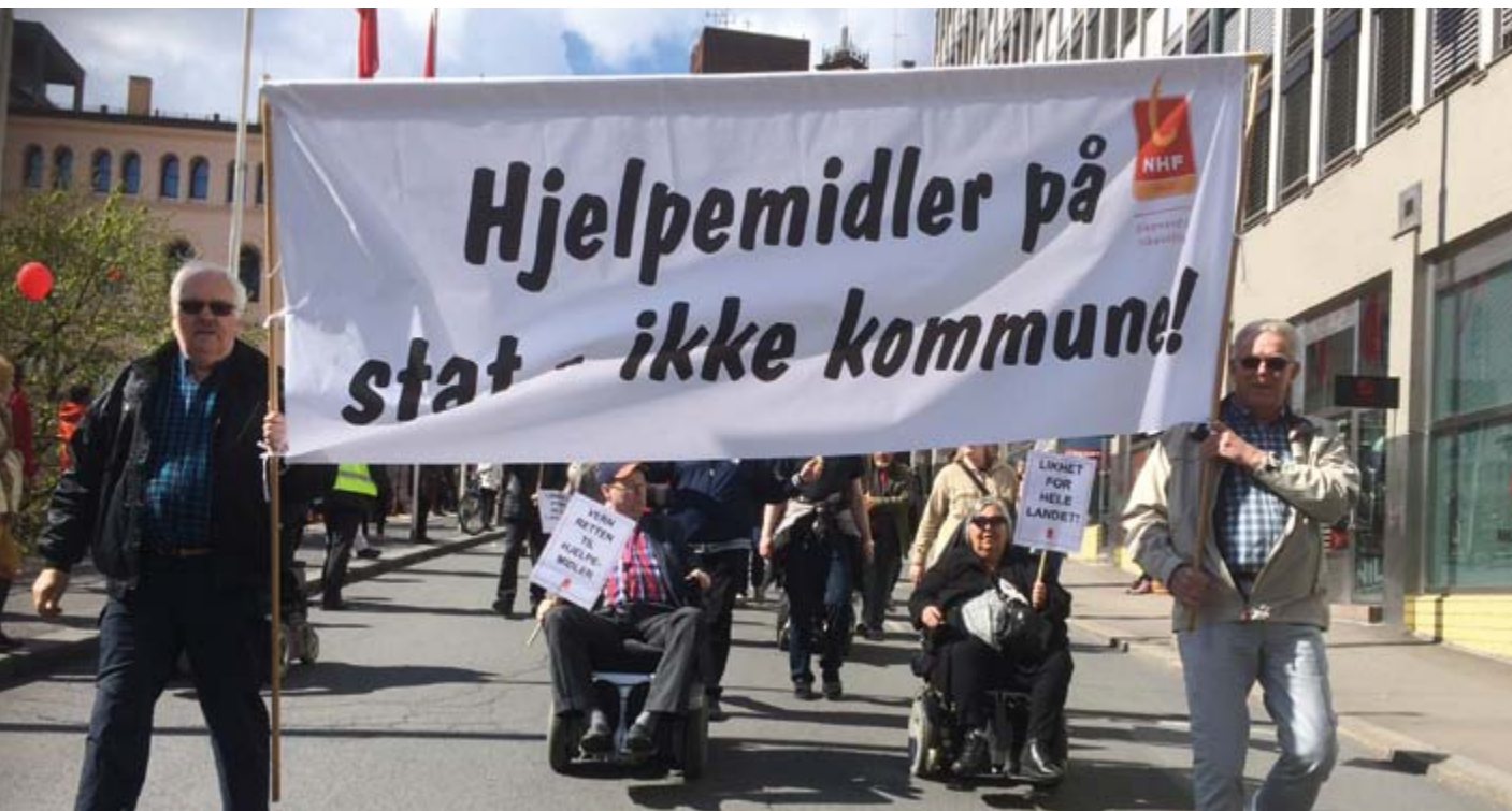
NHF Oslo deltok for første gang på mange år under årets 1. mai arrangement.

slik at en kan få svar på disse på selve møtet. Det er også lagt opp til erfaringsutveksling og samarbeid om saker med NHF's nasjonale nettverk. Samarbeidet med NHF sentralt er godt, og flere saker som er viktige for NHF Oslo har vært tatt opp i det sentrale brukerrådet for NAV.