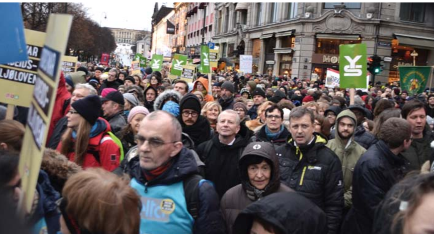
Endringene i arbeidsmiljøloven skapte stort engasjement i befolkningen og NHF Oslo som deltok i flere markeringer.

gjelder må gjelde alle faste reiser, samt fritidsreiser som bestilles via kjørekontor. Reisegarantien må tilsvare den som finnes for annen kollektivtrafikk, dvs tre i kraft etter 20 minutters venting og gi kompensasjon for erstattende drosjetransport.