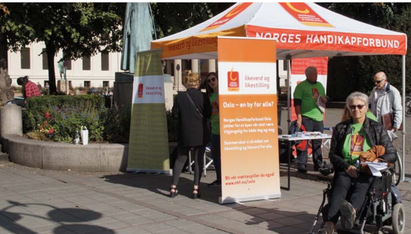
NHF Oslos valgstand ved Nationalteatret i forbindelse med kommunevalgkampen

har tatt inn deler eller enkelte punkter fra våre innspill inn i programmene, spesielt kan nevnes Venstre. I tillegg programfestet Oslo AP retten til å gå på nærskolen i sitt program etter vårt arbeid. Tilbakemelding fra flere partier viser at arbeidet med programmene er viktig.