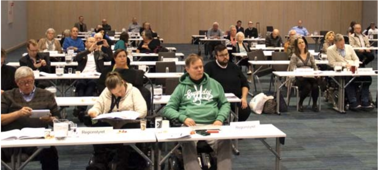
Stort engasjement under NHF Oslos 65. årsmøte.