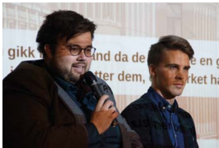
Stopp HatPrat har vært et stort satsingsområde i 2015.