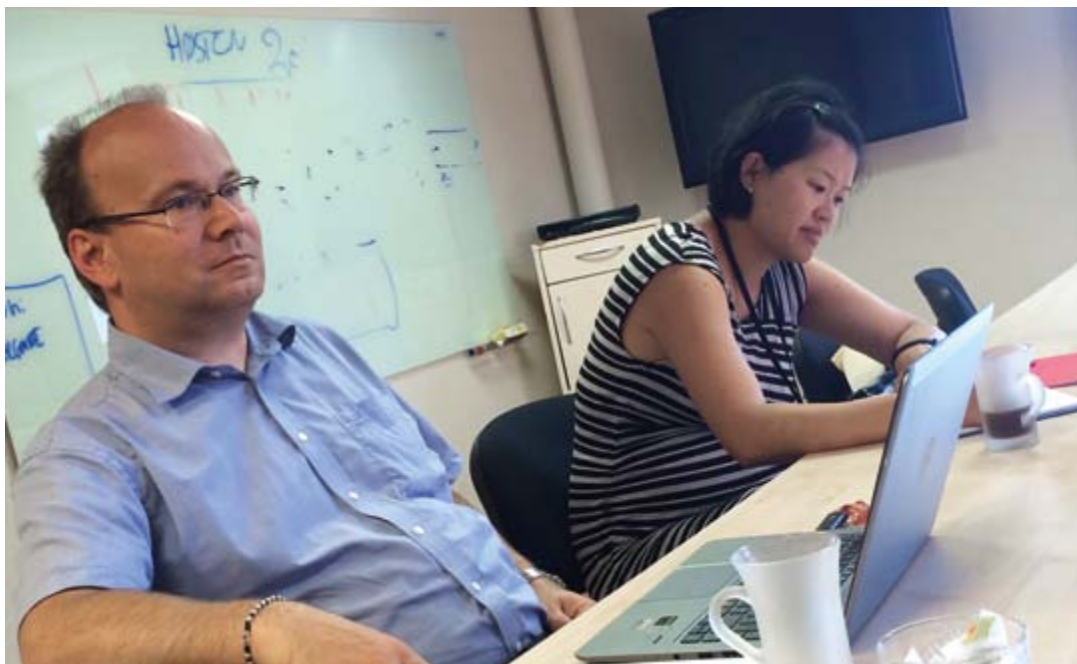
Representanter fra Ruter lytter og noterer våre innspill

ble etablert. Arbeidet i Samferdselsetatens brukerråd er i stor grad kanalisert til Levende Oslo. For øvrig har Ruter etablert sitt eget brukerråd (Ruters brukerråd), der det har vært noen møter, og der NHF Oslo har holdt foredrag om universell utforming og Metrostandard i kollektivtrafikken. Dette brukerforumet fungerer ikke optimalt.