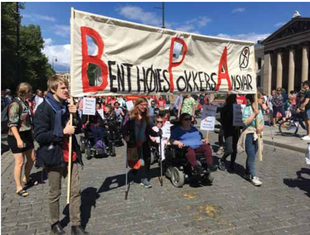
Parole: NHFUs banner fikk oppmerksomhet i Stolthetsparaden.