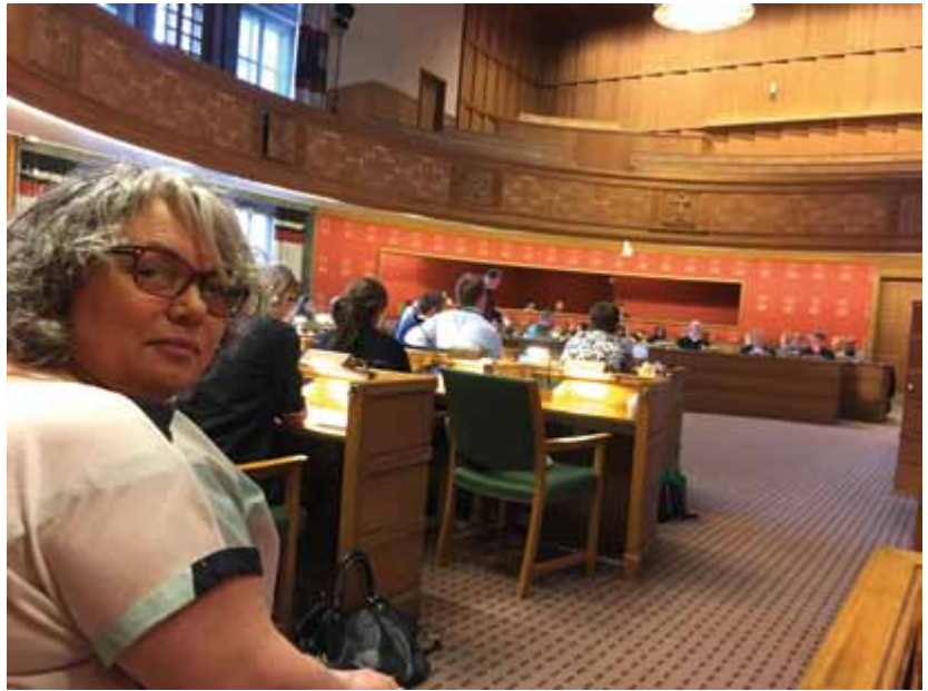
Påvirkningsarbeid: Representanter fra NHF Oslo har deltatt i en rekke befaringer, møter og høringer gjennom året.

for å skape et samfunn for alle. At universell utforming og tilgjengelighet som prinsipper er en del av lovverk og forskrifter er en stor seier for oss. Deler av byggenæringen og den sittende regjeringen har arbeidet for en justering og forenkling av plan- og bygningsloven med forskrifter. Vårt arbeid for å vise at universell utforming er nødvendig for noen, og bra for alle, er et langsiktig og pågående arbeid, og noe vi må sette ytterligere fokus på i fremtiden.