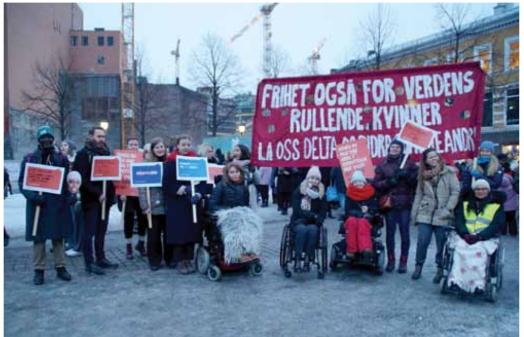
Førstereis: NHFU fikk sin parole inn som hovedparole i 8. mars-toget.