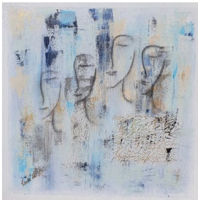
Nydelige bildet "Døtre" er laget av Vibecke Selliken.

i NHF Oslofjord Vest - av og for kvinner