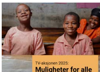
TV-aksjonen 2025: Muligheter for alle