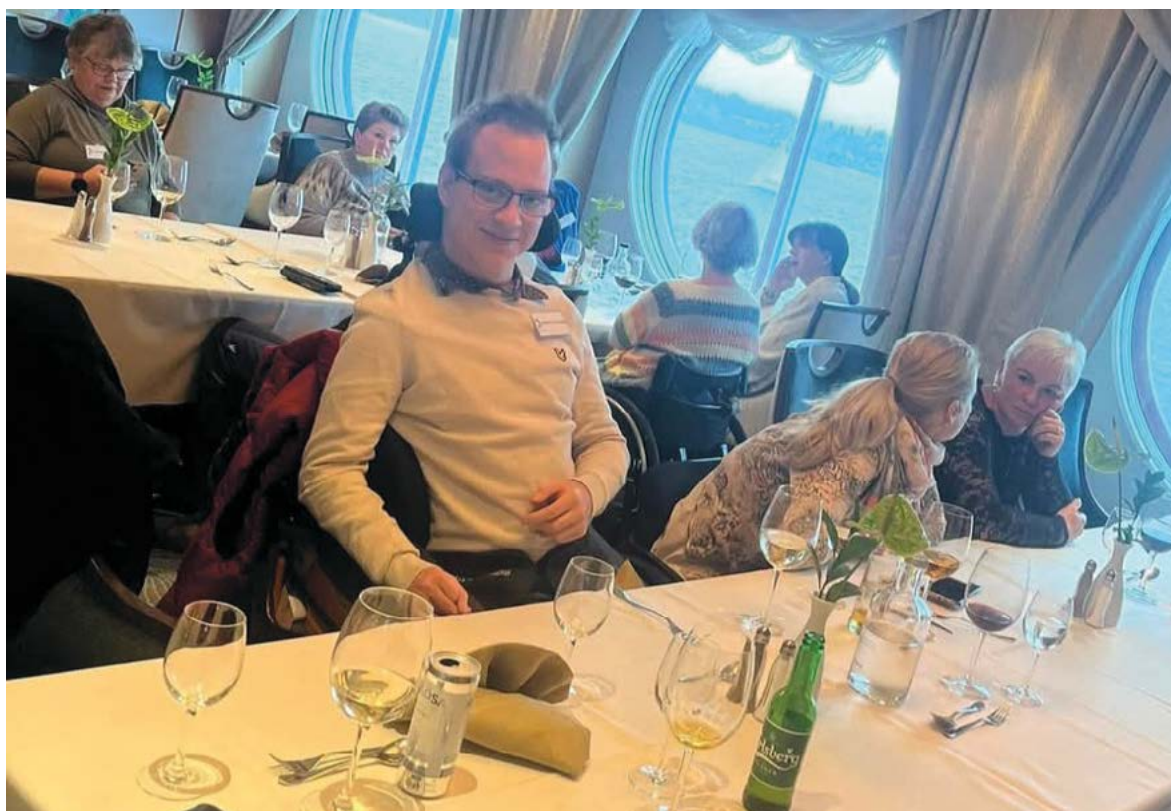
Mestringstur til Kiel