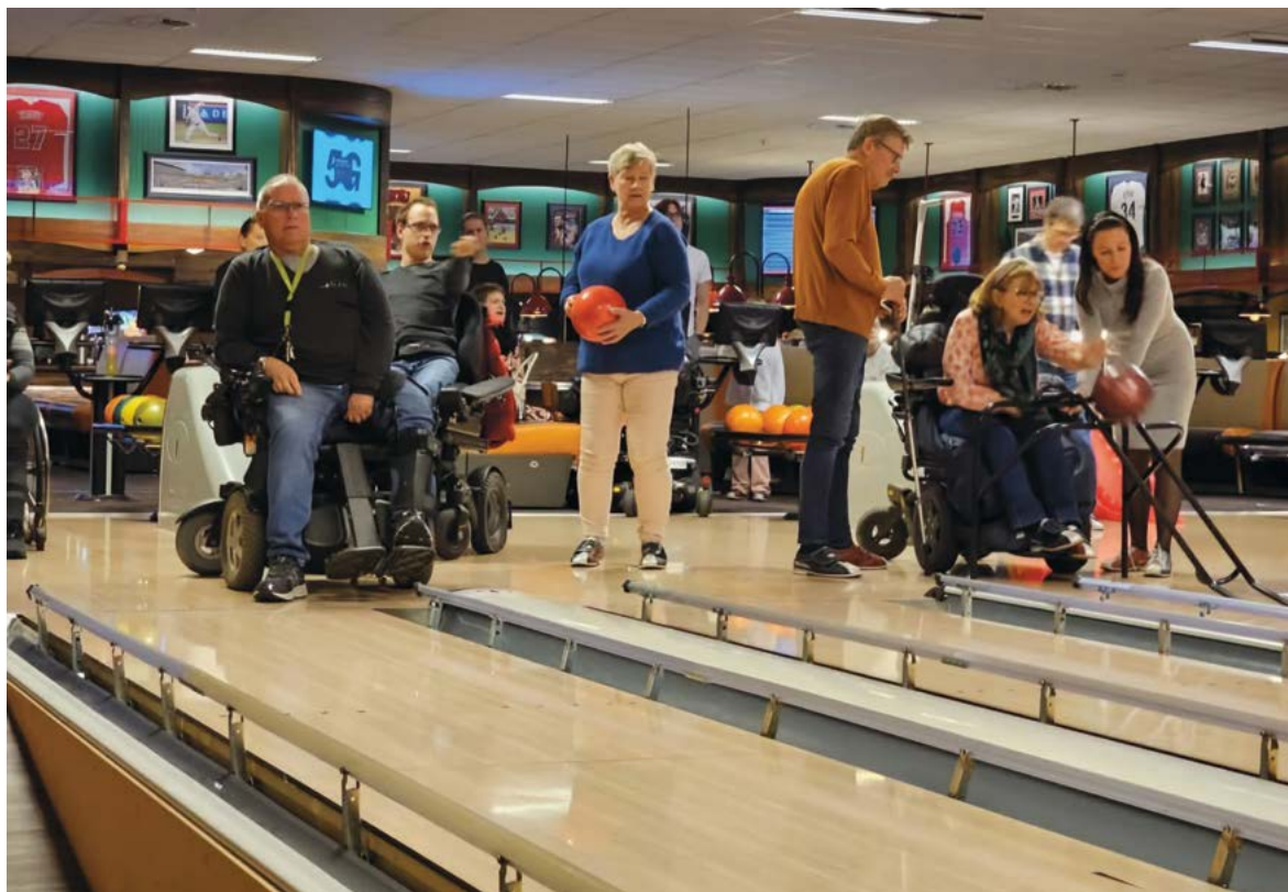
Bowling på Metro i Sandefjord.